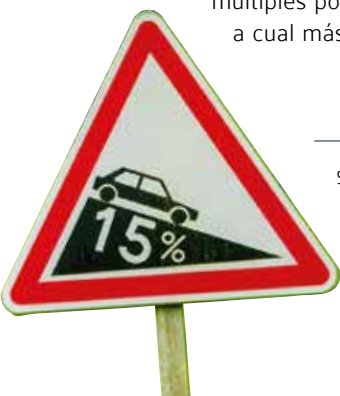
Señalización vertical que advierte de la presencia de pendientes máximas del 15%.

Por tanto, podríamos definir el Col de La Pierre Saint-Martin como la culminación final de un entramado múltiple de carreteras y collados que permite su ascenso por siete accesos diferentes, superando un total de cinco pasos de montaña previos a la coronación definitiva del puerto a 1.765 metros.