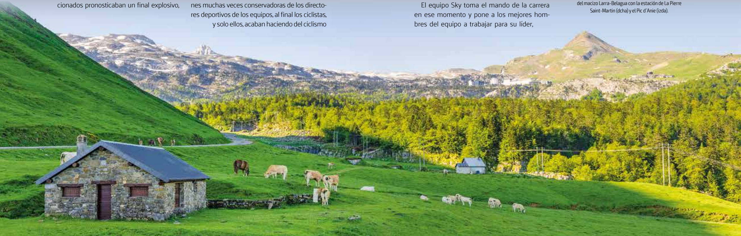
Vistas hacia los extensos prados y la zona más alta del macizo Larra-Belagua con la estación de La Pierre Saint-Martin (dcha) y el Pic d'Anie (izda).