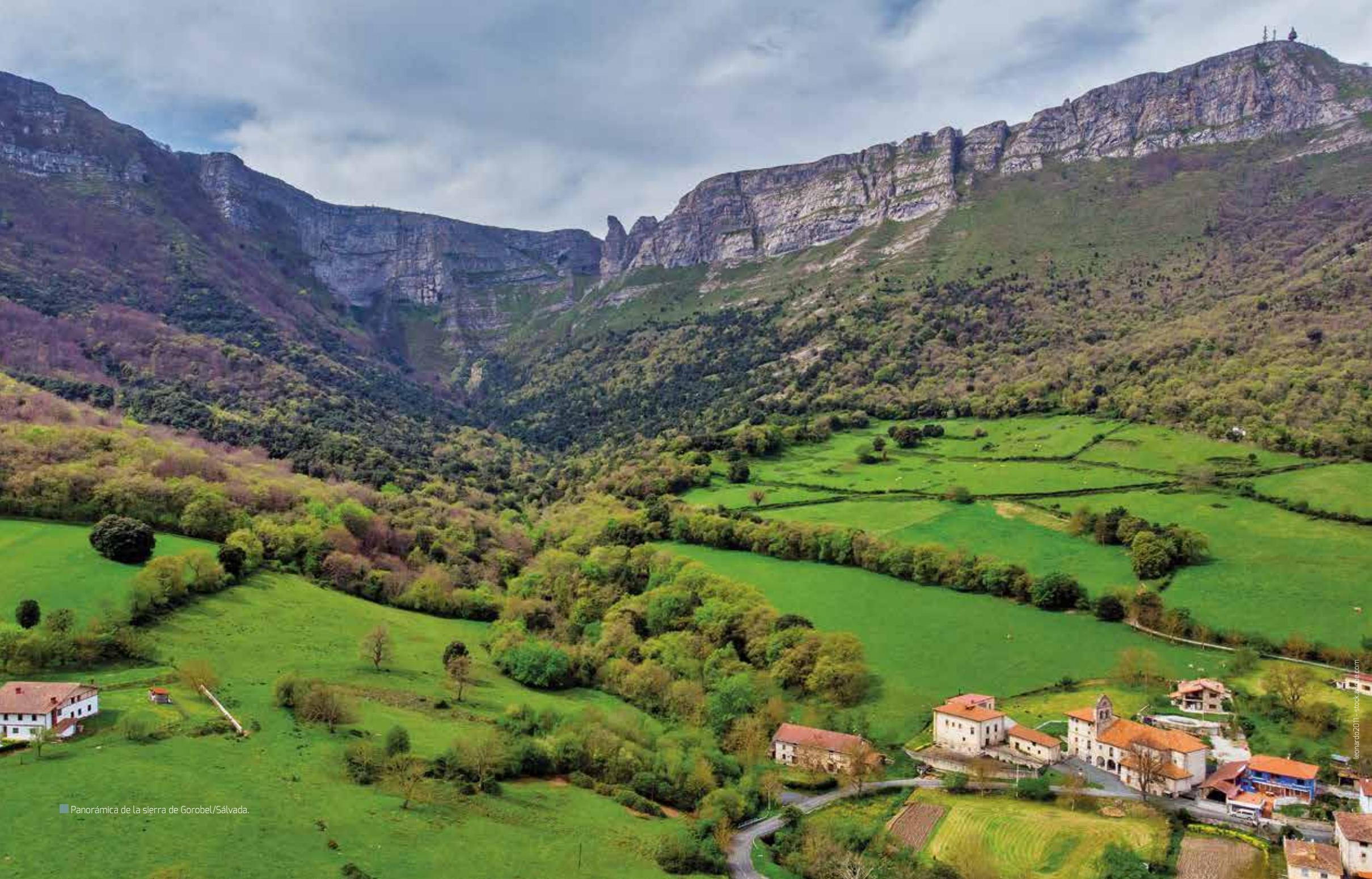
Panorámica de la sierra de Gorobel/Sálvada.