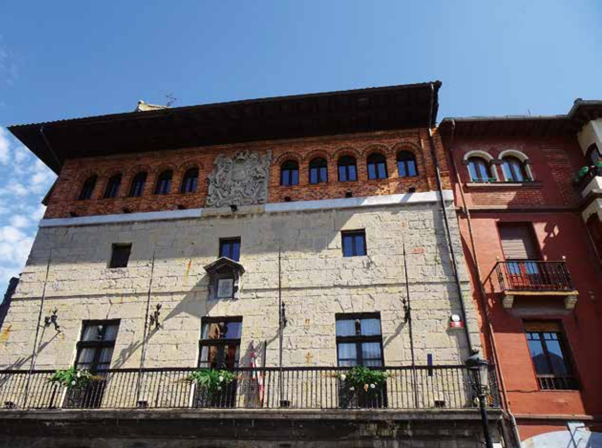
Fachada del ayuntamiento en la Plaza Mayor. ■

por el trasiego de mercancías. Poco duró con este uso. Posteriormente fue cuartel en donde se ubicaron desde las tropas de Napoleón, pasando por las leales a Alfonso XIII hasta las del ejército español. En la actualidad, como ya lo fue del 2006 al 2014, es un hotel-balneario.