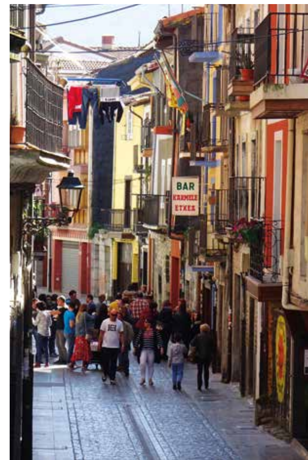
Ambiente en Orduña. ■

Es lógico que haya tanto y tan hermoso, no en vano Orduña no es solo una de las 21 villas de Bizkaia, es también su única ciudad. Y como ciudad que se precie tiene unas fiestas de amplísimo eco popular: los Otxomaíos, en donde se homenajea a la virgen de la Antigua. Miles y miles de personas, mayoritariamente jóvenes, se trasladan a Orduña desde muchos puntos de Araba y de Bizkaia.