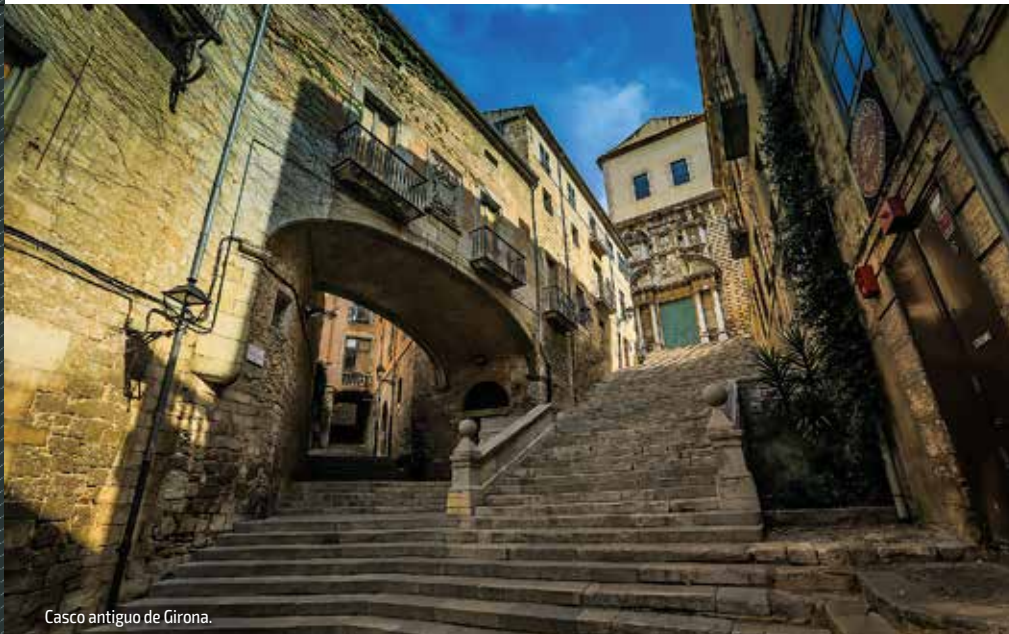
Casco antiguo de Girona.