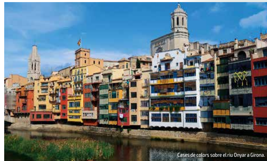
Cases de colors sobre el riu Onyar a Girona.