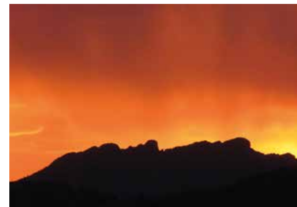
Cresterío de Aiako harria al amanecer.

Varias carreteras cruzan el parque natural. La ruta que se dirige a Aireko Palazioa (también llamado Castillo del Inglés) tiene su cota más alta