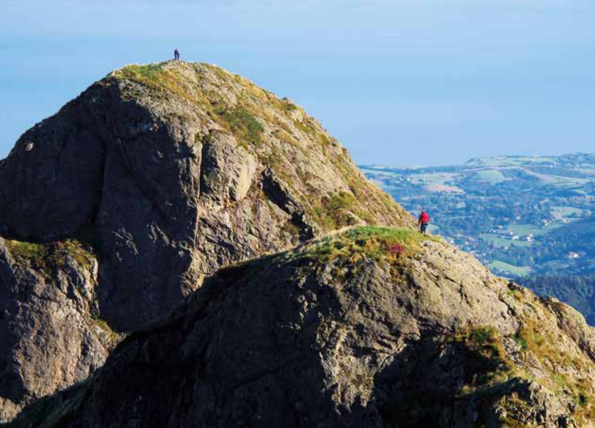
Cima de Txurrunmuru, desde Erroilbide.