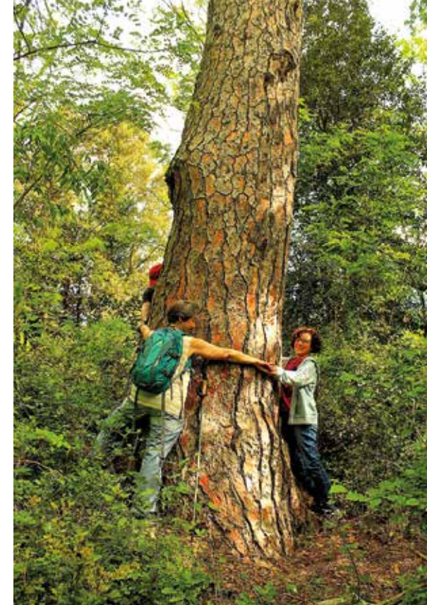
Excursionistes abraçant el pi gros.

tec. Quan encara no fa mitja hora que caminem trobarem la passera de ciment que ens ajuda a canviar de riba i a seguir per un camí amb molta més vista, passant al costat del Molí de la Capçana gairebé sense adonar-nos-en.