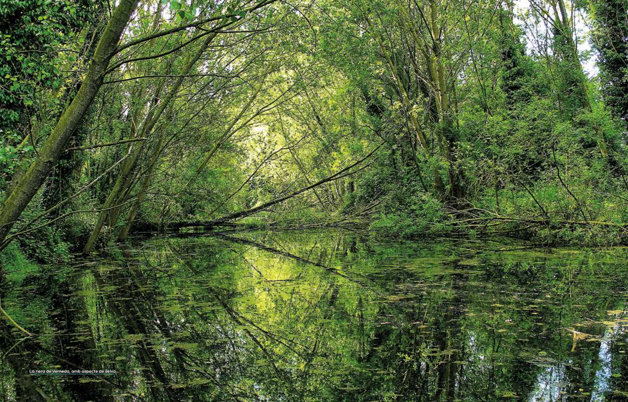
La riera de Verneda, amb aspecte de selva.