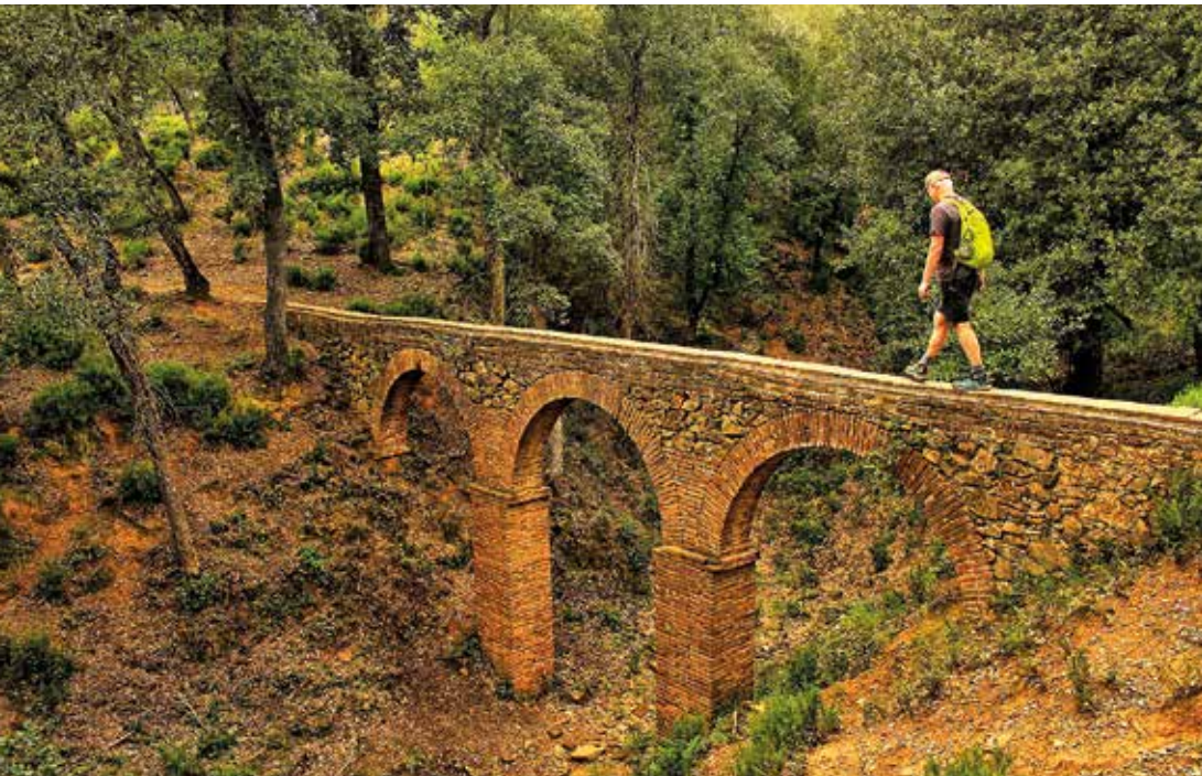
Salvant un dels aqüeductes de la riera.

just fins allà on acaben la resta d'arbres del bosc. Tota la capçada en sobresurt. Ho podem apreciar millor en els minuts següents, quan sortim a camp obert pels envolts del Mas Vilallonga Petit, que és dalt d'un turó, a la dreta.