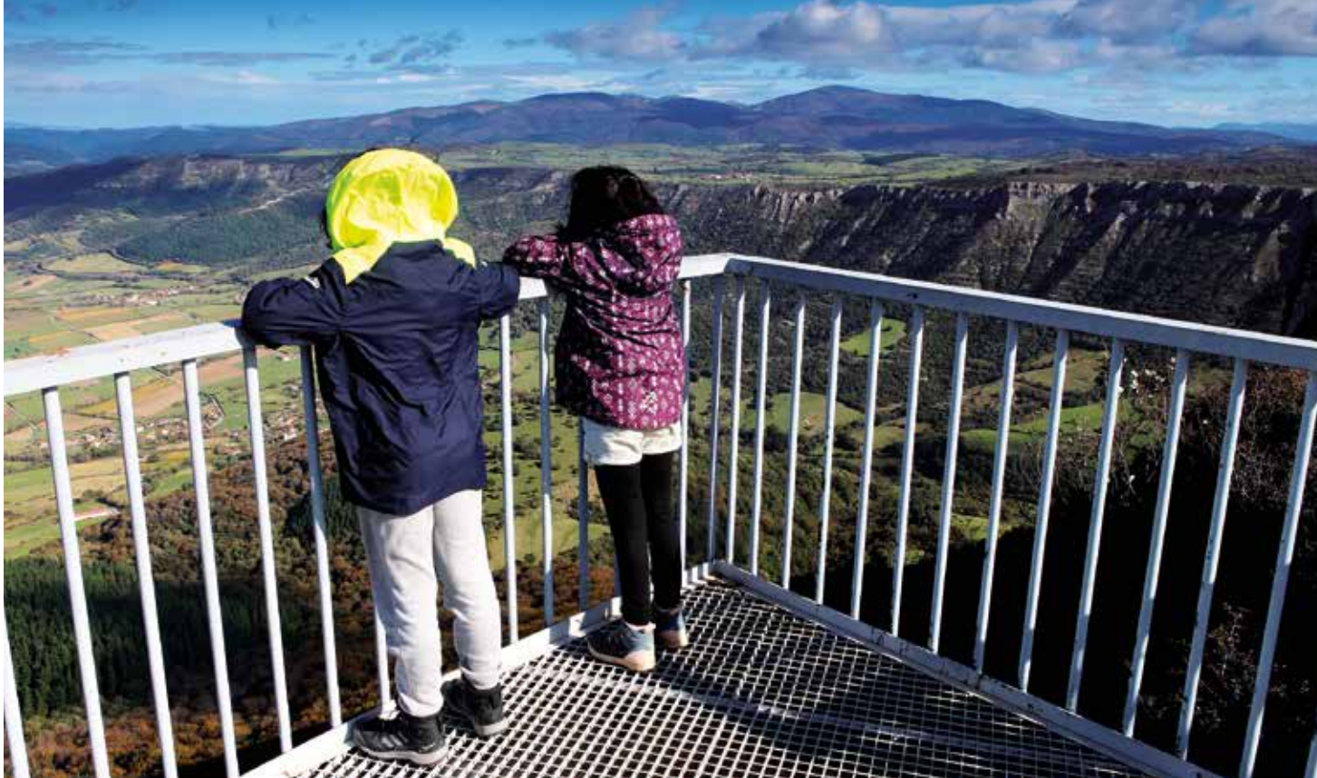
Esquina de Rubengo begiratokia.

(935 m, 20 min). Han zuzen jarraituko dugu.