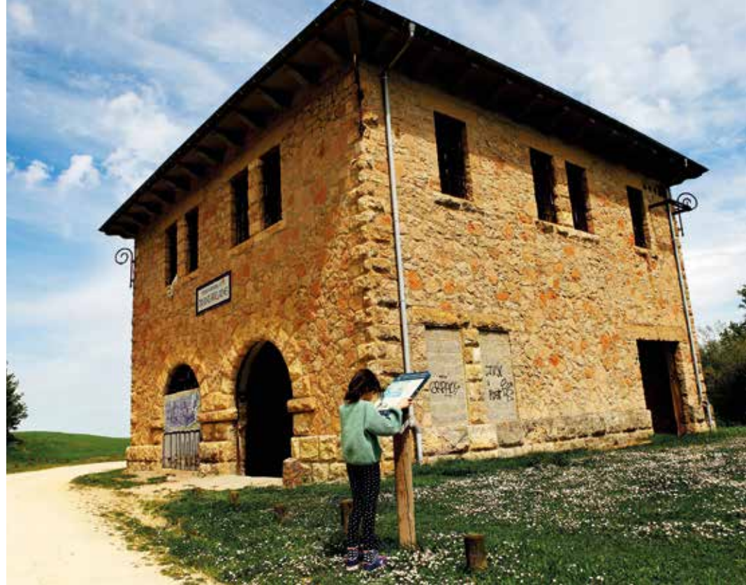
Errotaldeko azpiestazio zaharra.

haritz eta pago artean, urtegi txiki bateko hormara helduko gara. Ezkerrean utziko dugu, langa zeharkatu eta aurrerantz jarraitzen dugun bitartean. Gure atzealdean, Aizkorri-Aratz