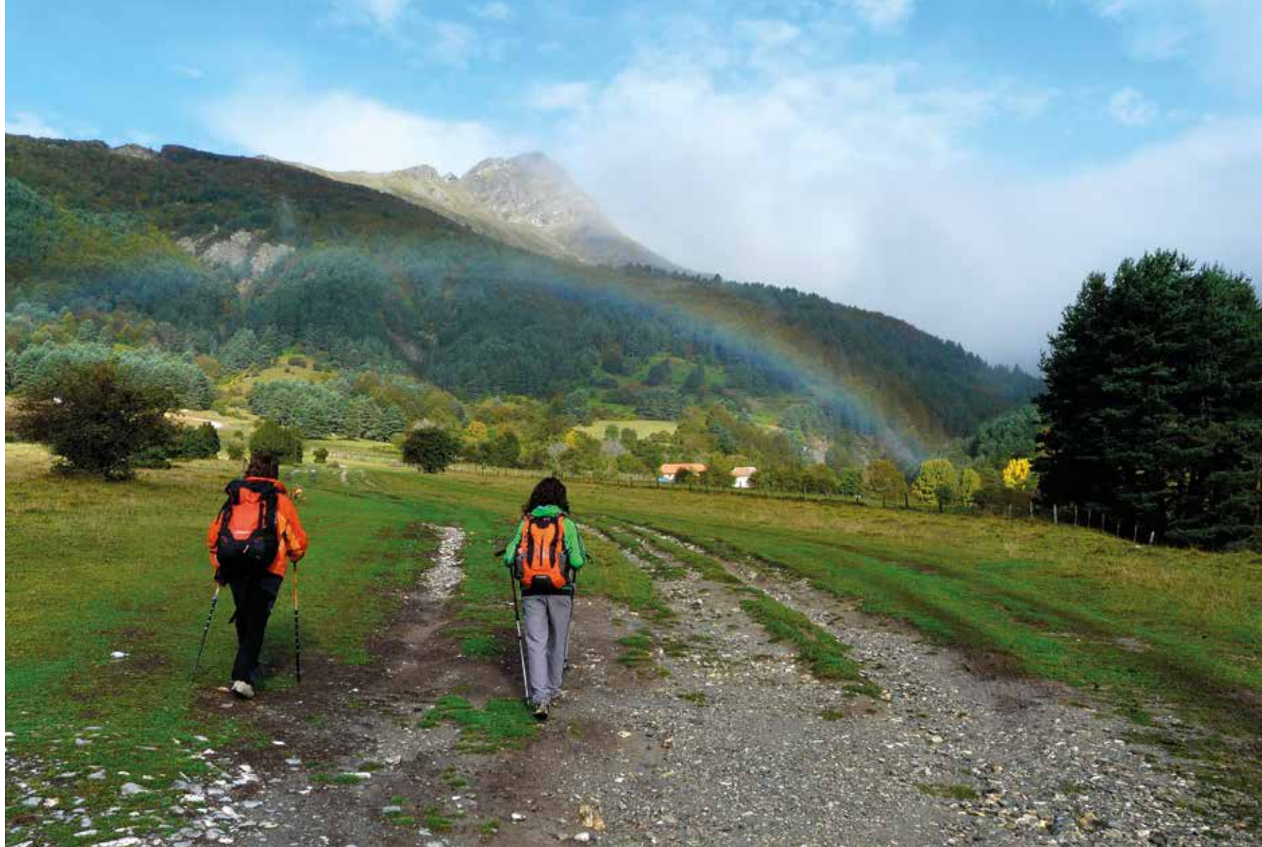
Bonita vista de Keleta desde Arrako Benta.

Caminamos al norte del antiguo cuartel militar y, tras rebasar un par de abrevaderos, alcanza-