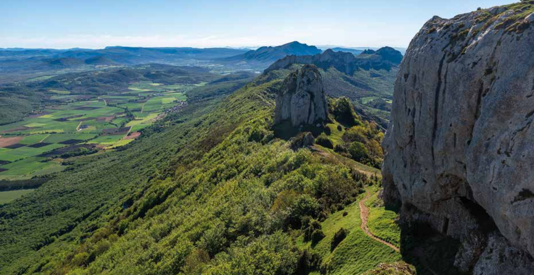
El Bonete de San Tirso y la ermita, en el cordal cimero.

Okon (750 m). Junto al aparcamiento podemos apreciar los aperos de labranza que existen en el lugar. En un panel informativo se explica la Ruta de los Caleros y la Carbonera, que se inicia por la misma pista que deberemos seguir nosotros para llegar a nuestro objetivo. El camino avanza hacia la sierra en dirección sur.