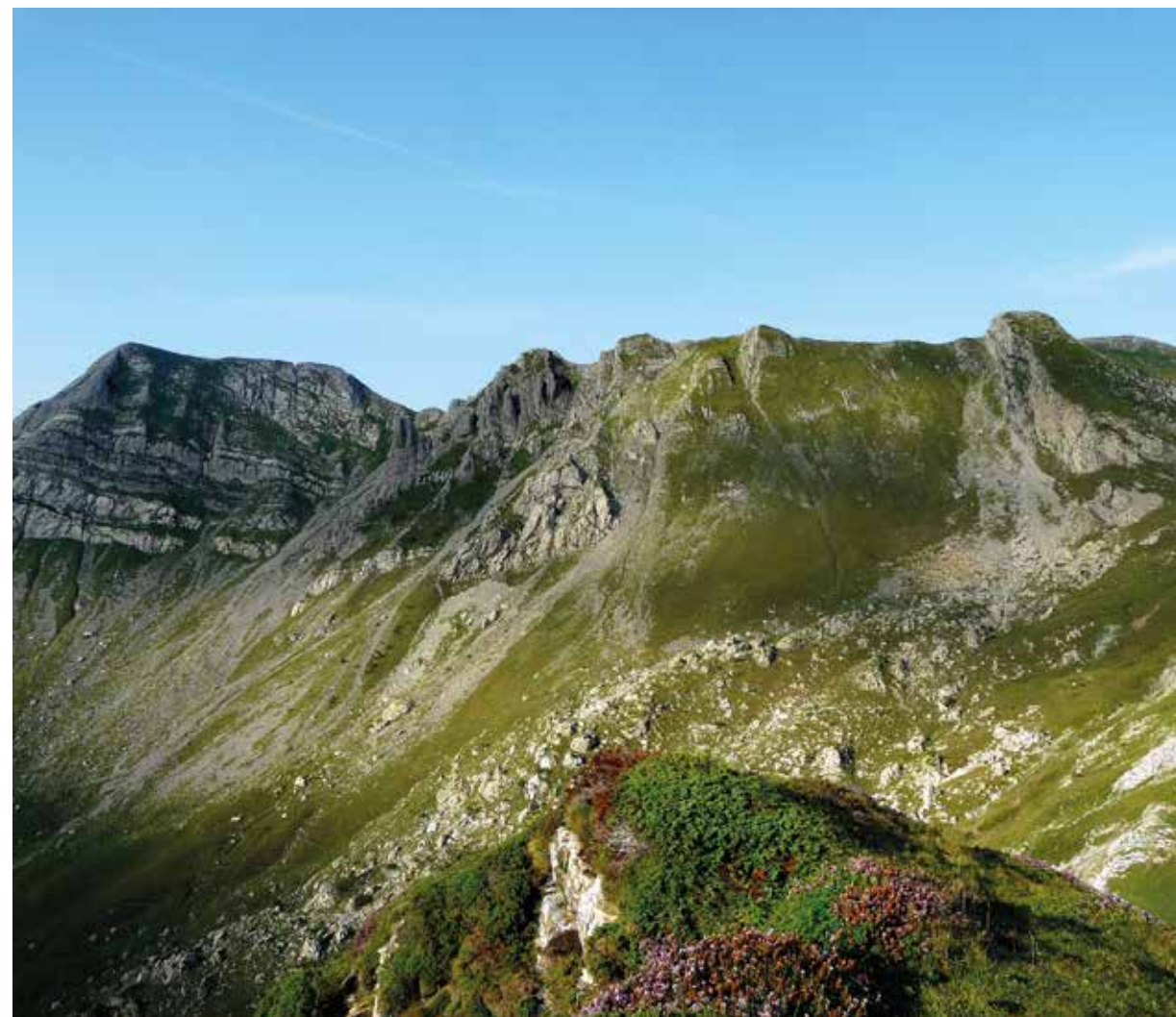
Panorámica de Keleta y Kartxela desde la cima de Binbaleta.

Para continuar nuestro recorrido y alcanzar la cumbre de Keleta debemos recorrer, con extremo cuidado, la rocosa y aérea cresta que nos lleva en dirección sureste. Tenemos que superar varias pequeñas cimas con pasos fáciles de escalada antes de alcanzar la cima. Será cerca