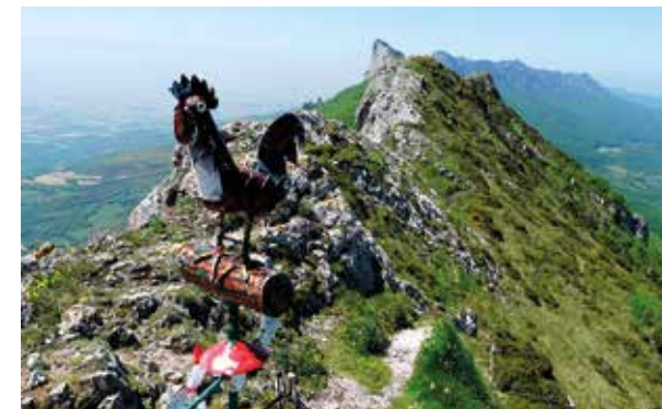
El buzón de la cima tiene forma de gallo.

Desde el puerto de Herrera hasta el de Bernedo se extiende la parte más espectacular de la sierra de Toloño. Los afilados y abruptos peñascos se alternan como si de una cresta de gallo se tratara. Podemos destacar las vertiginosas cimas de Palomares (1.443 m), cumbre que era considerada como la más alta de la sierra hasta que nuevas mediciones indicaron que este reconocimiento sería para la cumbre de Larrasa (1.454 m); y la