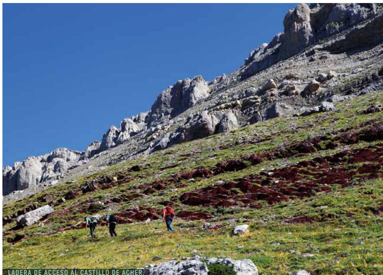
LADERA DE ACCESO AL CASTILLO DE ACHER.

Según ganamos altura sobre la desnivelada pradera y al alcanzar su parte superior, aparecen en el horizonte numerosos picos pétreos. Mientras disfrutamos de ese escenario, giramos a la izquierda, vamos hacia la base de la montaña y ascendemos por debajo de los