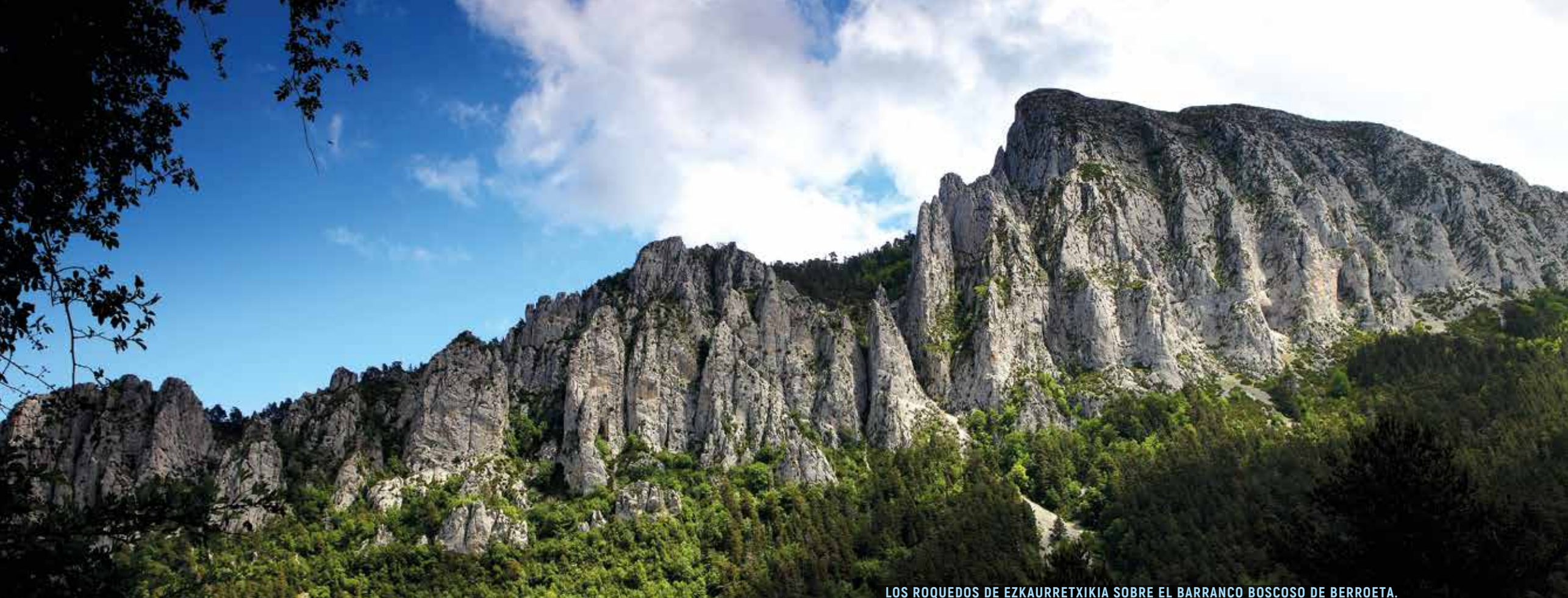
LOS ROQUEDOS DE EZKAURRETXIKIA SOBRE EL BARRANCO BOSCO DE BERROETA.

Recorrer las montañas que conceden forma a la cordillera de los Pirineos es un placer inmenso para todos los sentidos, y encaramarse a sus cimas redobla esa sensación tan satisfactoria. Sin lugar a duda, plantearse la culminación del ascenso de una montaña es la finalidad más ansiada del montañero. Sin embargo, no podemos olvidar que es el camino a la cima el que define la jornada, más allá de la cumbre en sí misma. Es por ello por lo que, en base a ese argumento, tan sencillo y extendido, y, muchas veces, tan ignorado, nos replanteamos aquí cómo subimos a esas montañas. No a cuáles, dado que, al fin y al cabo, las montañas son siempre las mismas. Eso no lo podemos cambiar. Pero sí podemos variar por dónde hacerlo y vivir nuevas experiencias.