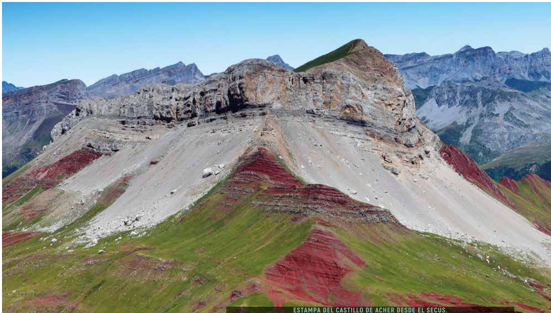
ESTAMPA DEL CASTILLO DE ACHER DESDE EL SECÚS.

Comenzamos junto a la carretera de Oza, en el punto en el cual hay un puente sobre el río, en las inmediaciones de la caseta del parque natural de los Valles Occidentales. Allí, evitamos unirnos al acceso hacia el Campamento Ramiro el Monje; nos sumamos al itinerario del GR 11.1 con destino al refugio guardado de Lizara. Caminamos por el bosque, parejos al