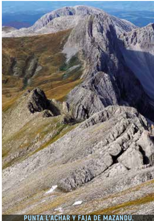
PUNTA L'ACHAR Y FAJA DE MAZANDÚ.

Desde el Orhi hacia los siguientes valles el paisaje varía totalmente. El desierto kárstico de Larra es una rotunda declaración de intenciones de lo que viene más allá, dado que la colección de afiladas puntas calizas se congrega sobre los valles inferiores, que, en sus cotas menores, perpetúan el verdor de praderas y bosques.